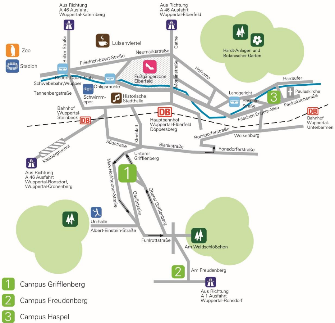
Abb.: Lage der Standorte in Wuppertal